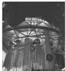
阿佐谷七夕まつり 毎年8月上旬開催。JR阿佐ヶ谷駅南口の700mの商店街「阿佐谷パールセンター」を中心に駅周辺商店街を会場として行われます。