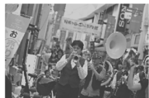
阿佐谷ジャズストリート 第一線で活躍するプロから地元の子どものバンドまでが登場し、阿佐谷のまち全体がジャズで溢れかえります。