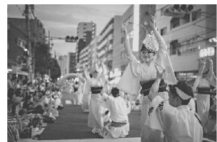
東京高円寺阿波おどり 毎年8月最終土・日の2日間開催しています。毎年、1万人の踊り手と100万人の観客の歓声が街にこだまします。