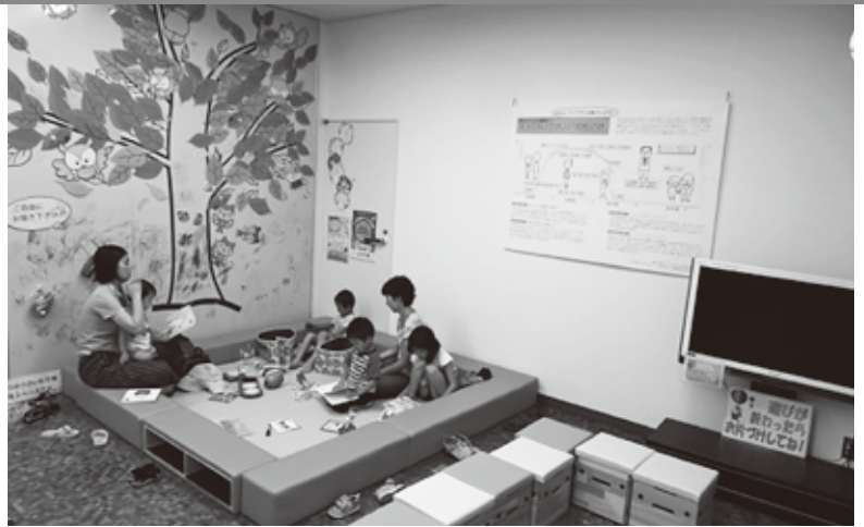
女性のライフプラン形成や若者全体への健康支援に関する情報発信スペース「鬼子母神 plus」