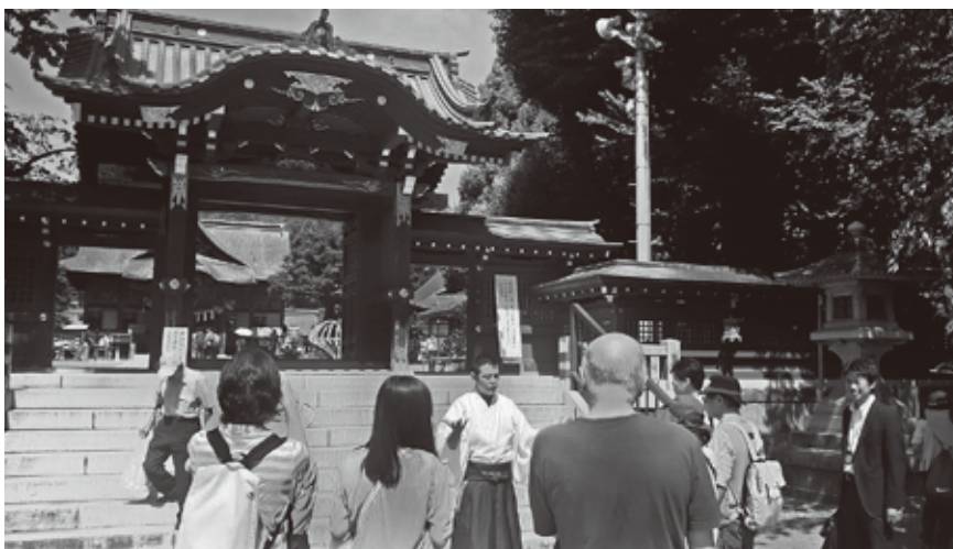
豊島区民に好評だった秩父市の移住・交流体験ツアー

これらの取り組みを通じて、秩父市の定住人口や、豊島区と秩父市の関係人口、自治体間の交流を増やし、お互いが人口を奪い合うのではなく、Win-Win（ウィン・