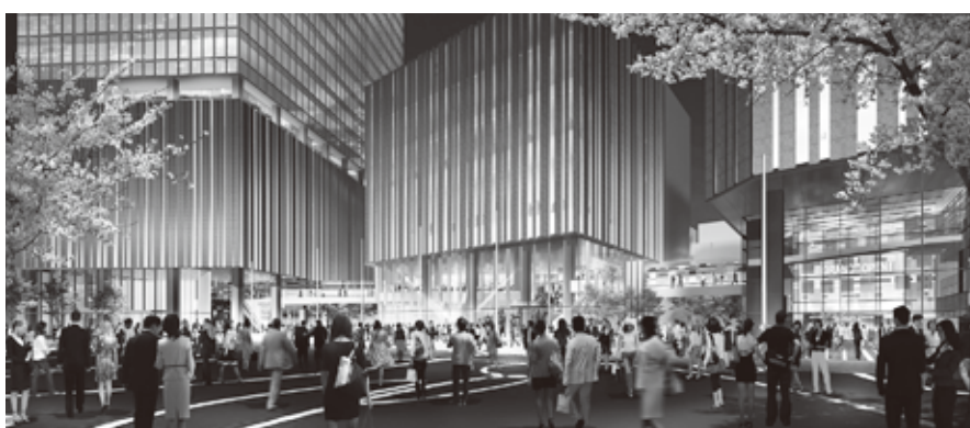
Hareza 池袋の完成予想図

かつてここには豊島区の庁舎と公会堂がありました。豊島区はその跡地を定期借地方式により民間活用。定期借地権の一括前払い地代19億1億円の一部を新庁舎整備費用の財源に充当するとともに、1300席の新ホールと民間施設（オフィス、にぎわい施設等）で、国際アート・カルチャー都市の顔となる文化にぎわい拠点、新たなランドマークを創