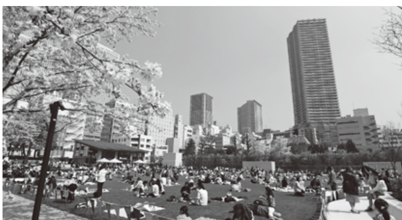
区民の憩いの場として生まれ変わった 南池袋公園

です。これを実現するため、2020 年東京オリンピック・パラリンピッ クまでに池袋駅周辺の四つの公園を 整備します。合計約3万平方メートルな る4公園それぞれの特色を活かし、 土日祝日には誰もが参加できる多彩 なイベントを随時開催。各公園を結