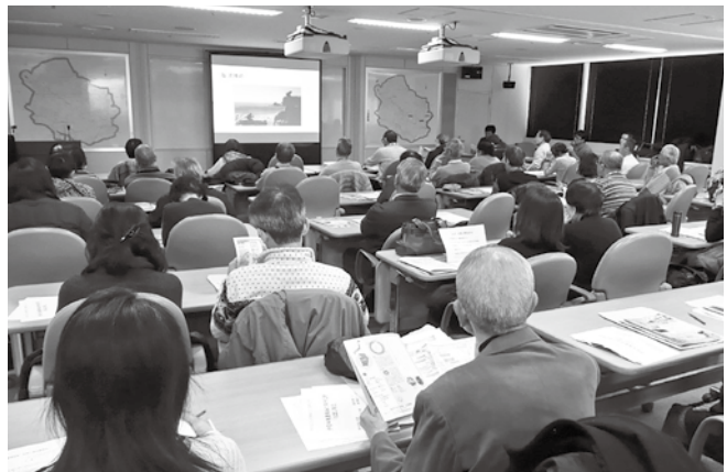
「お試し移住」の説明会にはたくさん区民が参加した

かけに、区立小学校の移動教室や保養施設の利用など、多くの区民が南伊豆町を訪れ、お互いの絆を深めてきました。東日本大震災の後、2012（平成24）年には災害時の相互援助協定も結んでいます。