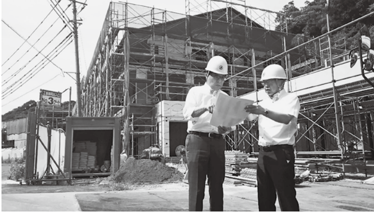
特別養護老人ホームエクレシア南伊豆の建設現場を視察する増田寛也顧問(左)

視点3は「地方の活力維持と区の将来にわたる発展が一体不可分である」という認識のもと、交流自治体と