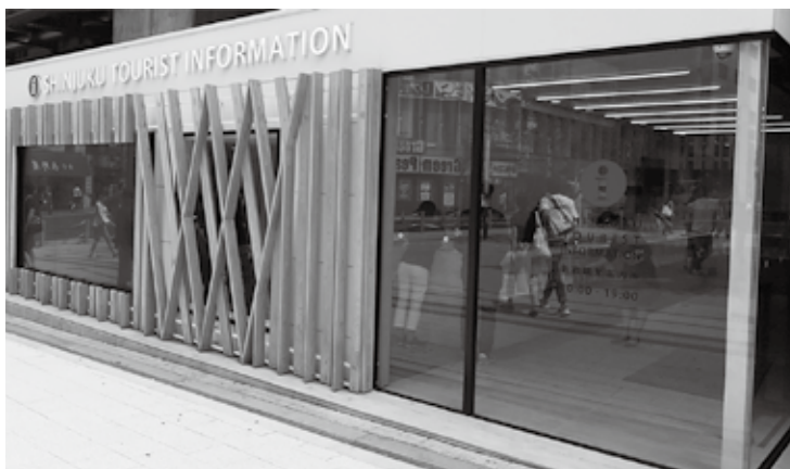
新宿駅東南口の新宿観光案内所