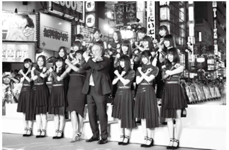
ゴジラロードで行われた映画ジャパンプレミアムのイベント

2016年4月に策定した「新宿駅周辺地域まちづくりガイドライン」によると、20年後をイメージした新宿駅周辺地域の目指す将来像について、「世界に注目され、誰もが自由に行き交う国際集客都市と世界と日本をつなぐ快遊都市へ」と掲げています。具体的には、①誰もが快適に回遊できる人中心のまち②国内・海外からの注目を惹きつけ、様々