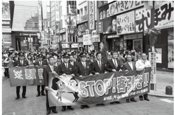
歌舞伎町ルネッサンス 客引き防止イベント

かりではありませんでした。戦後は「東洋一の歓楽街」と言われた歌舞伎町は、かつて「暗い」「汚い」「怖い」といったマイナスイメージが強く、新宿のイメージダウンにつながっていました。そこで、新宿区は地元商店街、町会、民間企業、警察や消防など関係行政機関等と連携し、誰もが安心して楽しめるまちを再生する取り組みとして「歌舞伎町