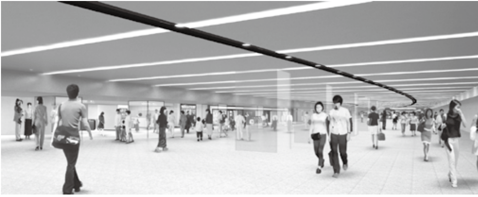
新宿駅東西自由通路の予想図