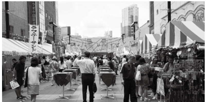
シネシティ広場で開催された「沖縄フードガーデン」

ルネッサンス」を進めてきました。具体的には、地元商店街振興組合や警察等と連携した客引き防止パトロールやキャンペーン、防災・帰宅困難者対策、落書き防止対策、歌舞伎町アートプロジェクトなどの取り組みです。また、ビルの上からゴジラが街を見下ろすゴジラロード（セントラルロード）では映画のプレミアイベント