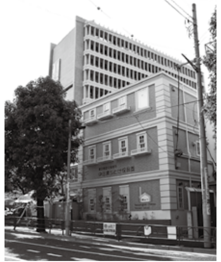
目黒区役所の未利用地を活用した中目黒ちとせ保育園（後方の建物が目黒区総合庁舎）