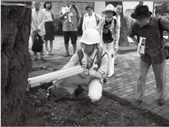
サクラの保全に向けたサクラ診断見学会

「目黒のサクラ」も目黒区の大切な財産です。区役所のみどり公園課に聞いてみると、目黒区は区民や団体からの寄付を「目黒のサクラ基金」として集め、地域の人たちとサクラの再生に取り組んでいます。 2018（平成30）年度は、呑川本流緑道、立会川緑道のサクラ再生実行計画を策定します。樹木診断の結果により倒木の危険のあるサクラの伐採や、再生実行計画に基づいた