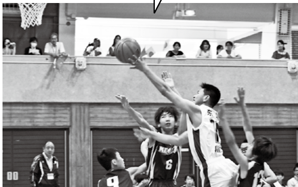
バスケットを通じた3カ国間の国際交流