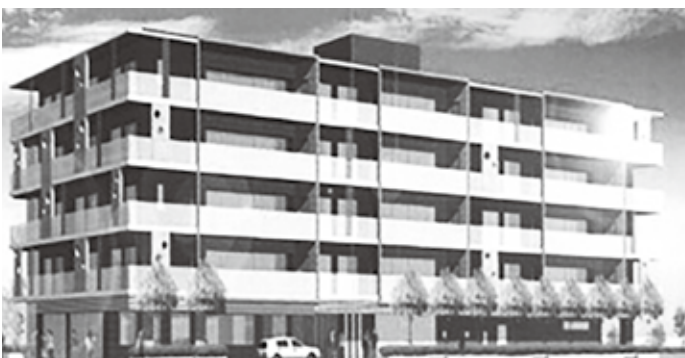
旧区立第六中学校南側跡地に整備される特別養護老人ホームのイメージ図