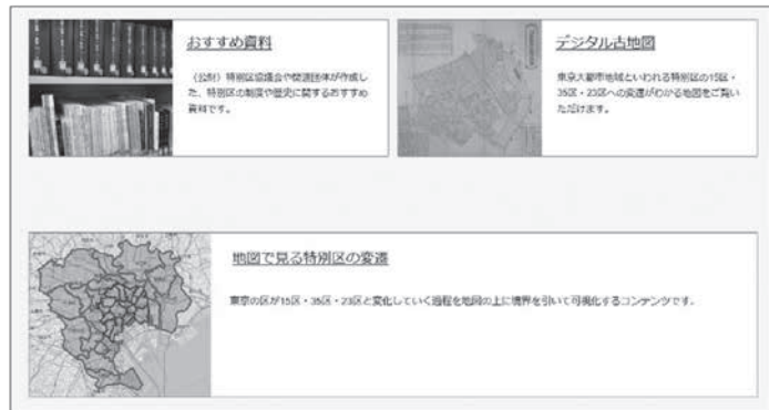
コンテンツの一例

杉並区魅力紹介展示「荻窪三庭園 ―荻外荘公園・大田黒公園・角川 庭園―」を開催します