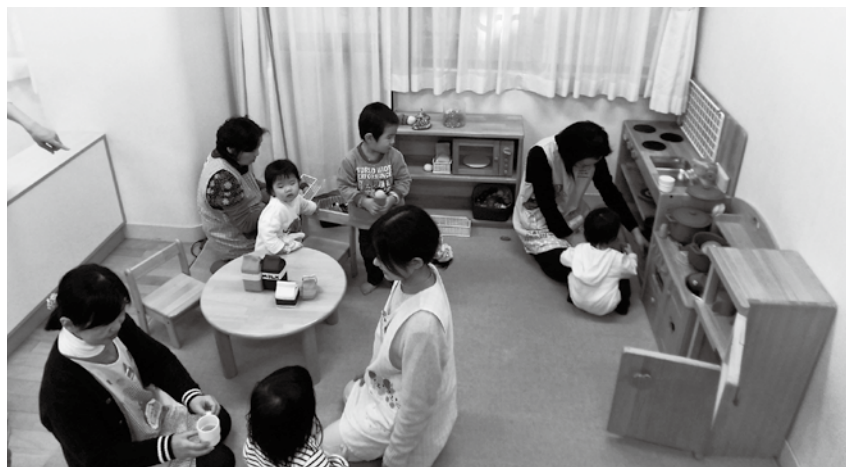
子育て家庭を支援する「子ども家庭支援センター（みずべ）」

園」として登録してもらい、保育園が行っているイベントや行事の案内、子育てに役立つ情報を掲載したお便りを送付したり、保育園職員による育児相談などを実施しています。