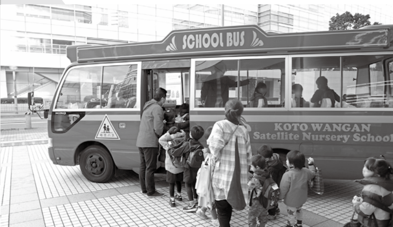
サテライト保育の送迎の様子

江東区では2013（平成25）年4月に待機児童数が過去最高の416人にまで増えました。待機児童の解消のためには大量の定員確保が必要です。とはいえ、待機児童がいるエリアに大規模物件がなく、賃料も高騰していました。そこで、他の自治体でも事例がある送迎ステー