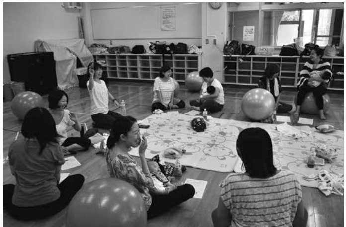
出産前後の悩みや不安を軽減する産前産後セルフケア講座

北区版総合戦略は基本方針として、(1)「生まれる」「つながる」「ひろがる」「支える」きずなづくりを区民とともに推進、(2)「生まれ・育ち・住んで良かったと思える」北