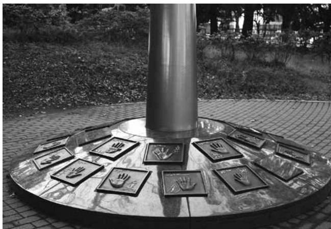
北区ゆかりのアスリートの手形を設置したモニュメント

区立稲付西山公園には、北区ゆかりのアスリートの手形を設置したモニュメントがあります。また、日本トップレベルの指導者や選手から直接指導を受けるスポーツ教室を開催し、技術向上と東京2020大会開催の気運醸成を図っています。2017（平成29）年度には、スポーツボランティア制度を創設しました。東京2020大会に向けたボランティアニーズに応えるため、スポーツ現場のボランティア