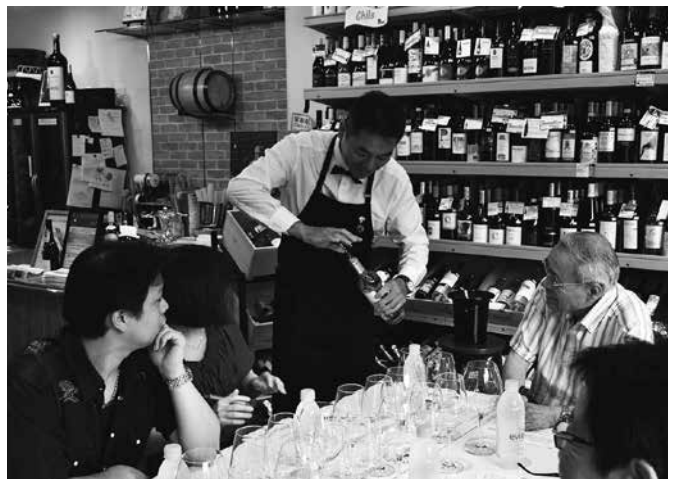
多種多様な講座がそろう「まちなかゼミナール」

2016(平成28)年からスタートし、年々、店舗と参加者が増えており、2018(平成30)年には86店舗が参加、延べ1585人が受講しました。参加者の満足度は97.8%と大好評です。「ソムリエが教えるワイン初級講座」「悪い姿勢とポッコリお腹！改善方法を学ぼう」など、