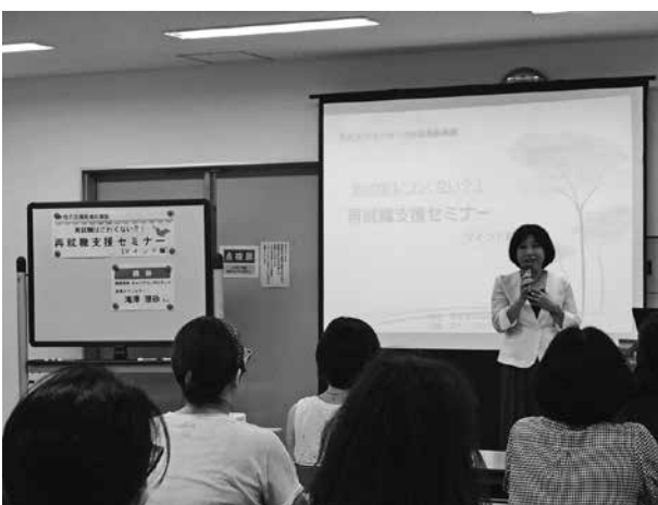
女性の再就職などを応援する女性の活躍推進応援塾

国や東京都、ハローワーク等と連携しながら、多様な人材の就業・能力向上を支援するとともに、企業と女性・若者・高齢者とのマッチングの場を提供するなど、雇用の促進を図ります。また、高齢者が生涯元氣