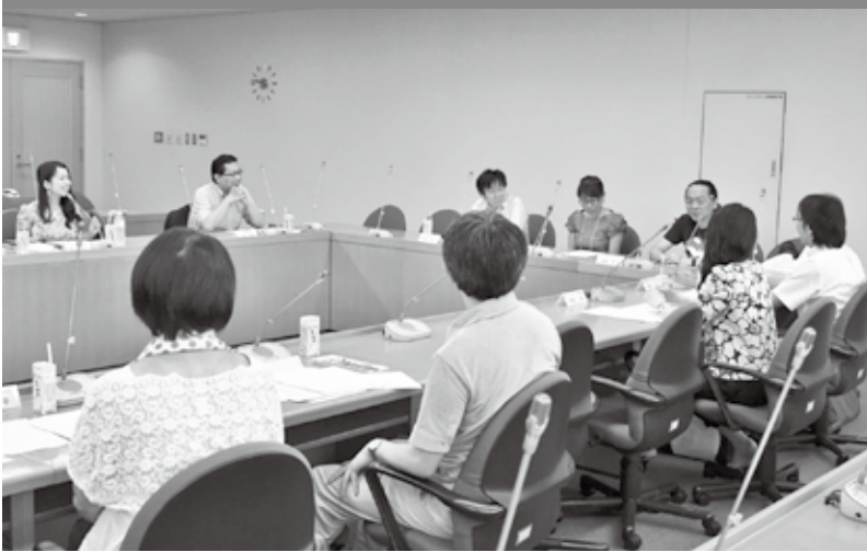
多様な視点でアイデアを提供する「ふんきょうハッピーベビー応援団」の会議

応援団会議は、結婚・出産・育児等について学識経験者、妊娠・出産を支援している関係団体、民間事業者、区を構成員とする応援団が、それぞれ取り組んでいる内容を共有するとともに、行政が行う少子化対策について、多様な立場からのアイデアを提案します。