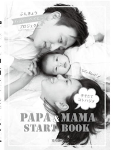
『PAPA & MAMA START BOOK』