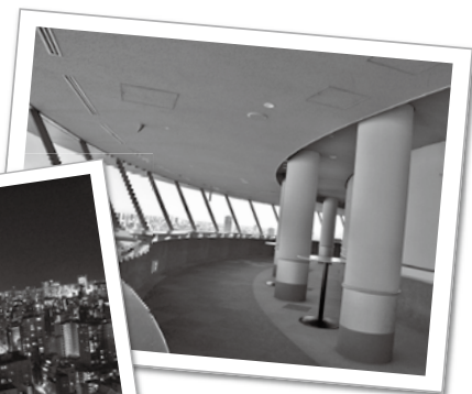
約330度の眺望を無料で楽しめる文京シビックセンターの展望ラウンジ

通の便が良く、大学をはじめ多くの学校が区内に設立され、人口が増加してきました。戦時中に戦災で人口は減りましたが、戦後は小石川・本