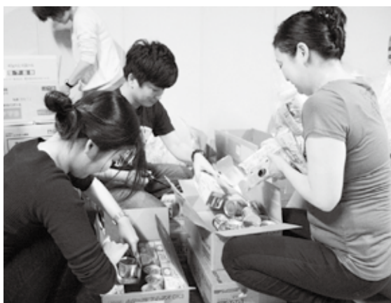
子どもに届ける食料を仕分けするボランティアスタッフ

という点に意義があります。ふるさと納税の現状に一石を投じるとともに、自治体が寄附金の使途を明確にして資金調達する「ガバメントクラウドファンディング」の成功例として、取り上げられています。