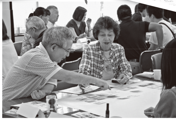
2019年6月に開催された 基本構想に関する 区民ワークショップ

ができます。また、参加者に地域への関心を深めてもらうことができ、地域の活性化につながるという効果も期待できます。