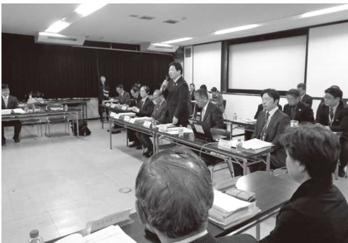
2019年4月に設置された中野区基本構想審議会

今回の基本構想の改定と基本計画の策定は、より幅広い区民が検討に参加することにより、区民の意見や生活実態を反映したものとします。そのため、検討の各段階に