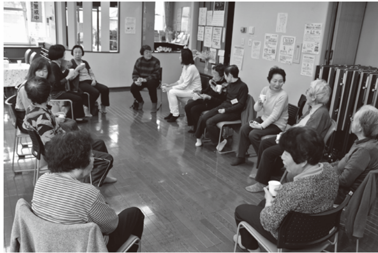
高齢者会館では利用証をカード化し、見守りなどに生かす実証実験を実施

区は昨年度、ICTを活用した在宅医療介護連携システム「なかのメデイ・ケアネット」を導入しました。これは、病院、診療所、介護事業者、行政などがご自宅で療養される方のお身体の状態や支援経過などの必要な情報をパソコンやタブレットを用