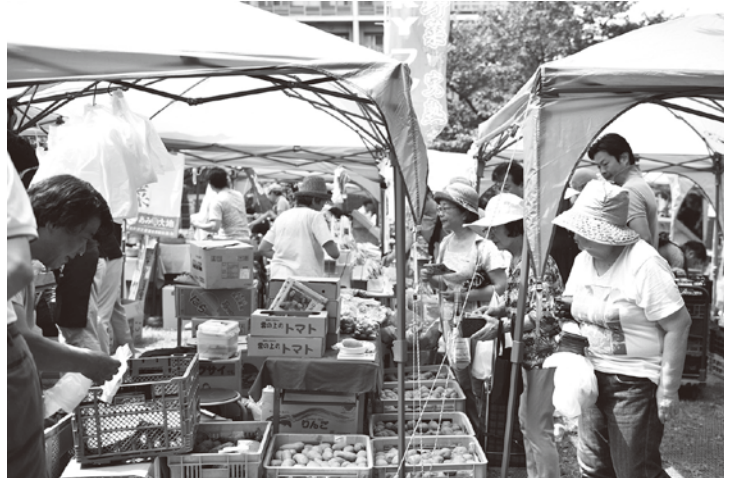
全国の特産物が手に入る全国連携マルシェ in 芝浦