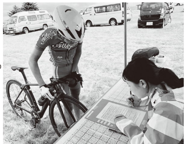
サロベツ100マイルレースの運営に携わる宗谷版ワーキングホリデー参加者