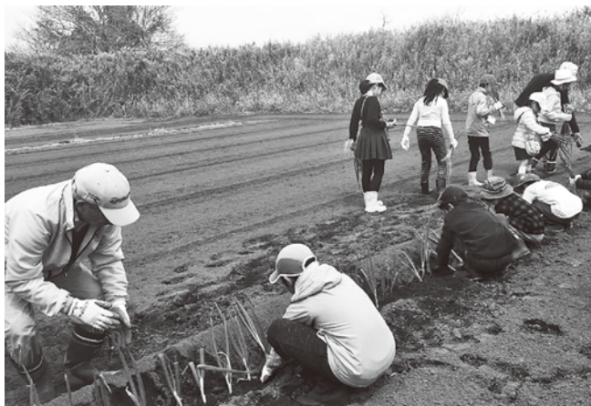
芝地区が茨城県稲敷郡阿見町との協働で実施している体験学習プログラム

今年も赤坂・青山地域の小学生が郡上市を訪れる「田舎の夏休み体験教室」や、郡上市の中学生が区内