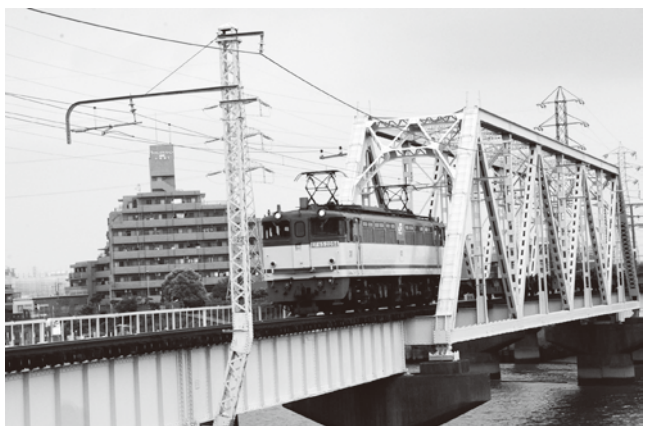
旅客化が検討されている新金貨物線

交通事業者、区が協働し、公共交通網の充実を図ることで、区民だけでなく、来訪者にとっても便利な街にしていくことができるのではないのでしょうか。