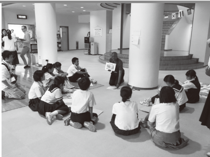
宿泊で英語漬けの生活ができる イングリッシュキャンプ

2018（平成30）年度の全国学力・学習状況調査で、葛飾区は小・中学校ともに全国平均との前年度比較で成績がアップしました。その背景には、特徴的な教育施策があります。