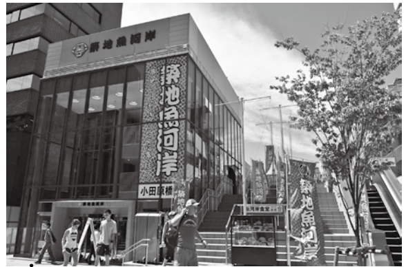
築地市場移転後の…… ……にぎわいの拠点「築地魚河岸」

「築地魚河岸」は、築地市場移転後も築地の活気ににぎわいを将来に向けて継承するため、中央区が設置しました。「食のプロに支持され、一般客・観光客にも親しまれる、食