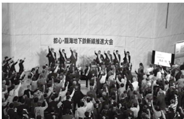
都心・臨海地下鉄新線推進大会

中央区は2014年度から臨海部と都心部を結ぶ地下鉄新線の導入に関する調査の検討を始めました。区が検討したルートは、銀座付近から国際展示場付近までの4・8キロという路線です。2016年4月の交通政策審議会答申「東京圏における今後の都市鉄道のあり方について」では、常磐新線（つくばエクスプレス）の延伸との一体整備として、「国際競争力の強化に資する鉄道ネットワークのプロジェクト」に位置付け