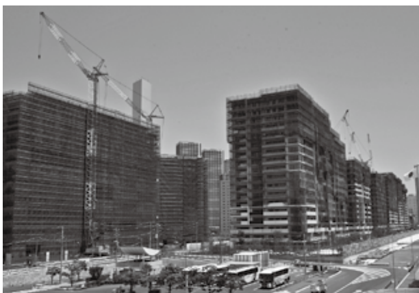
着々と整備が進む選手村

晴海地区にできる選手村は、開催時には1万8千人の選手・役員・大会関係者が利用し、開催後には5千戸以上の分譲・賃貸住宅として再整備が行われ、約1万2千人もの人口増加が見込まれます。東京2020大会のレガシーとして選手村だけでなく晴海地区全体がにぎわいと活気に満ちたまちとなるよう、小中学校をはじめ、様々な公共・公益施設や公共交通の整備・充実が重要となっています。