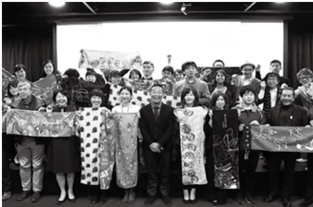
障害者や福祉に対する意識のバリアを取り除く「超福祉展」(2018年)

「基本目標3 ダイバーシティ&インクルージョンの推進」では、「国籍・年齢・性別・障害等で区別することなく、多様な人々が活躍できる環境を整備し、互いを理解し、受け入れるための意識改革の実現に資する施策を推進することで、まちの活性化を図ります」としました。 重点対策には、「ダイバーシティとインクルージョンの啓発による意識改革の実現」「障害者等の地域生活支援策の充実」「多様な世代の社会参加の推進」「グローバル社会にはばたく子どもの育成」を挙げてい