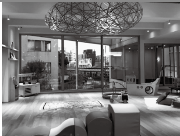
こどもテーブルの総本山となる「景丘の家」