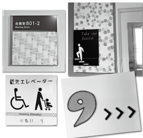
庁舎のあちこちに散りばめられた「シブヤフォン」

2015（平成27）年10月まで使われた旧庁舎は、ゆるくカーブを描くオシャレなデザインで親しまれました。しかし、次第に執務スペースが狭くなり、老朽化も進んだため新庁舎に建て替えられました。 玄関を入ると、開放的なロビーが広がっていました。エスカレーターを上がって、2階には福祉関