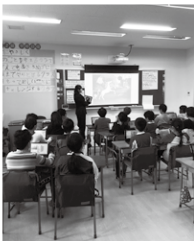
タブレットを活用した授業

たオフィスには壁やパーティションがなく、執務室全体を見渡すことができます。組織の壁を取り払い、縦割りをなくするのが狙いです。渋谷区流の働き方改革です。