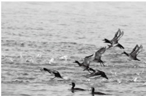
2万羽以上飛来するスズガモ