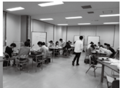
子どもたちが安心できる居場所「e-りびんぐ」

その結果、家庭環境や経済的理由から高校への進学や夢を諦めざるを得ないケースがあることや、子どもの日用品や学習用品を用意できない保護者がいること、一日三食とれず、