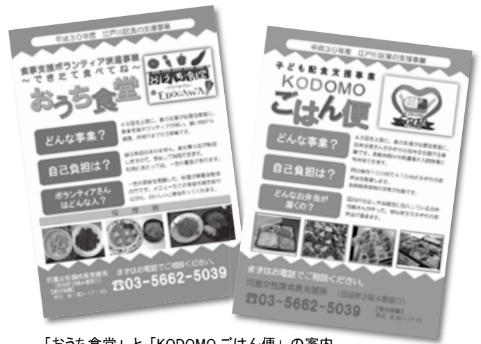
「おうち食堂」と「KODOMO ごはん便」の案内

成29)年8月からは、子どもに直接食事を届けようと、「おうち食堂」と「KODOMOごはん便」が始まりました。 「おうち食堂」は、食事支援ボランティアが家庭に伺い、自己負担なしで買い物から調理、片付けまで行う事業です。対象は、区が食の支援が必要と認めた家庭40世帯。1世帯48回、ボランティアを派遣します。 「KODOMOごはん便」は、区の仕出し弁当組合に所属するお弁当屋さんが470円の手作り弁当を自己負担100円で届けます。対象は区