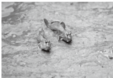
干潟に生息するトビハゼ