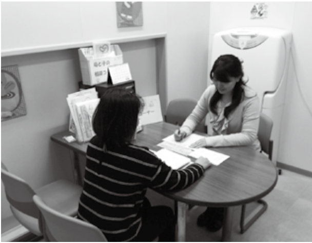
妊娠期から不安や悩みを相談できる「世田谷版ネウボラ」

そこで、2015（平成27）年4月からの子ども計画（第2期）の重点政策である「妊娠期からの切れ目のない支援・虐待予防」に基づき検討し、2016（平成28）年7月か