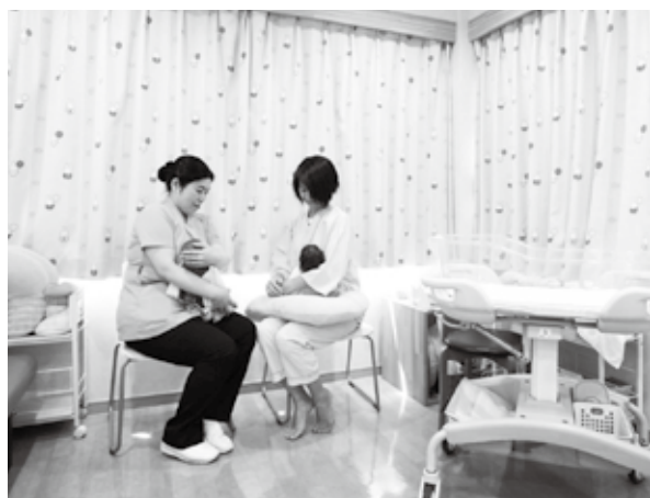
産後ケアセンター（母子ケアの様子）

世田谷区には小児医療の拠点となる国立成育医療研究センターがあり、重度の障害のある子どもや医療的ケアが必要な子どもが多く住んでいます。そこで、区では、配慮が必要な子ども・家庭への支援として、「医療的ケアが必要な子どもの預かり」に向けた取り組みを進めています。区では、児童発達支援事業と居宅訪問型保育事業を組み合わせて、長時間の預かりを実施できる体制づくりを行い、2017（平成29）年