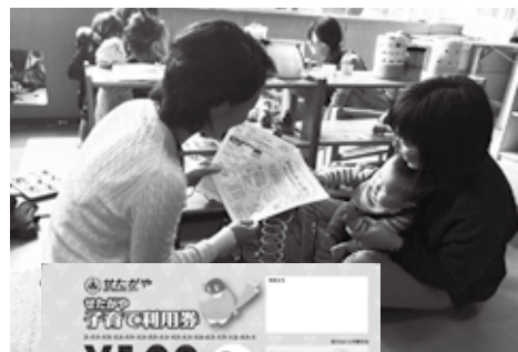
地域子育て支援コーディネーターの相談風景

初回の面接では、「せたがや子育て利用券」（1万円分）を渡します。これは、乳房ケア、産後ケア、家事・育児援助、親子の集いの場、一時預かり、育児講座などの地域の民間支援団体などが行う子育て支援サービスの利用の際に使用できます。この利用券は子育て家庭が地域とのつ