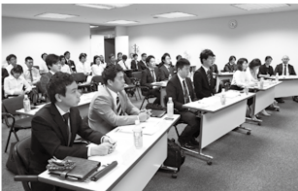
次代を担う経営者を育成する「フロンティアすみだ塾」

江戸時代から日用品や生活用品を作る職人が多く住み、「ものづくりのまち」として発展してきた墨田区。しかし、最近では、「ものづくりの