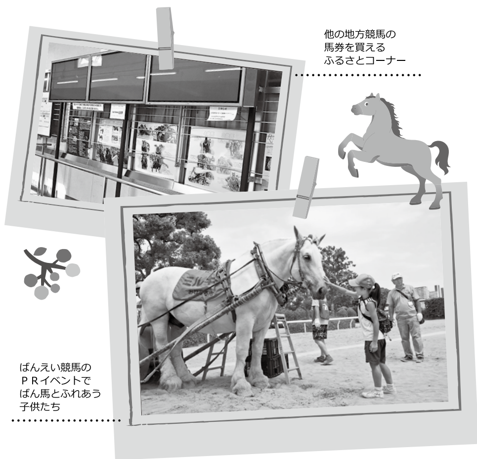
ばんえい競馬のPRイベントでばん馬とふれあう子供たち

潟）、オoops中郷（新潟）オフト伊勢崎（群馬）、オフト大郷（宮城）、オフト京王閣（東京）、オフトひたちなか（茨城）、オoops磐梯（福島）による物産展を実施。地元の野菜や地酒などを販売しました。また、当日にはオフト・オoops場外発売所