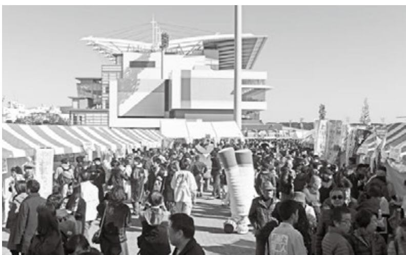
ウマイルスクエアで開催された 全国ねぎサミット

の「利きネギ選手権」、ネギ産地によるPR企画などが行われました。国内最大級のフードフェス「肉フェス」との初のコラボレーションも実現しました。