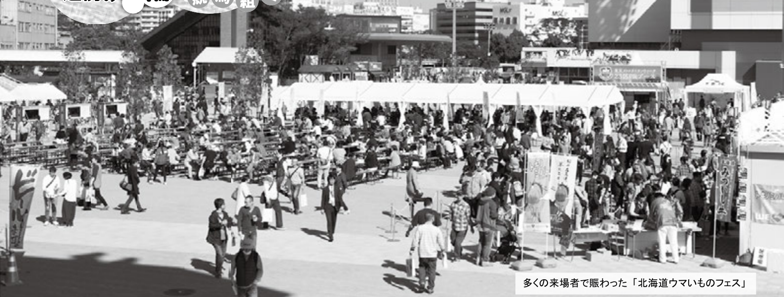
多くの来場者で賑わった「北海道ウマイものフェス」