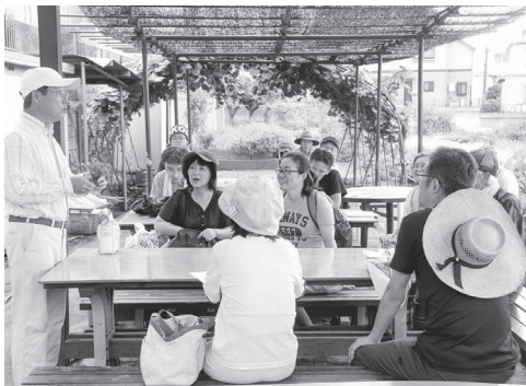
農業体験農園で学ぶ様子

農業体験農園は近隣住民に都市農業への理解を深めることに加え、農業者と利用者間の交流の輪を広げ、コミュニティづくりの場にもなっています。