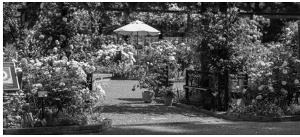
四季の香ローズガーデン

ほかに、NHKの連続テレビ小説「らんまん」のモデルである、牧野富太郎博士（植物分類学者／練馬区名誉区民）の住居と庭の跡地を一般公開している「牧野記念庭園」、みどりに囲まれて泥遊びや畑づくりなど自由に遊べる「こどもの森」、大きな芝生と屋根付広場がある「大泉学