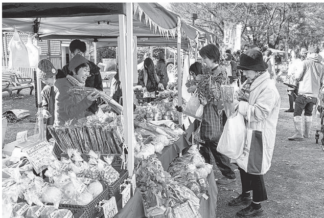
練馬区の旬に出会えるマルシェ