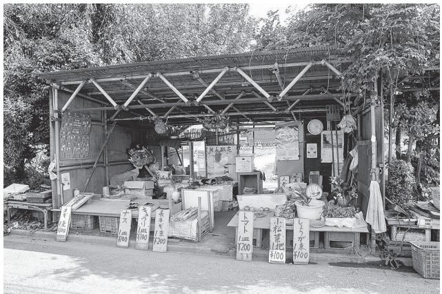
いろいろな野菜が買える直売所