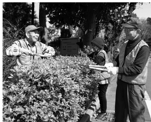
憩いの森の区民管理活動