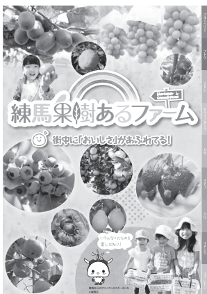
練馬果樹あるファーム紹介冊子

区内ではブルーベリー、ブドウ、ミカン、キウイフルーツ、カキ、イチゴなど、たくさんのおいしい果物が栽培され、四季折々の果物を味わうことができます。「摘み取り園」と「直売所」が生活に身近な場所であり、気軽に楽しめるので、「練馬果樹あるファーム」と名づけました。区では、摘み取り園と直売所情報のほか、農園周辺の飲食店等のスポット情報も盛り込んだ「練馬果樹あるファーム」紹介冊子を制作しており、観光案内所などで配布しています。また、今年10月からは野菜版の「ねりまベジかるファーム」もスタートしました。