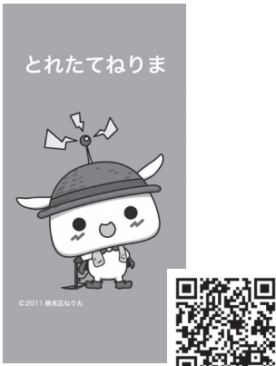
アプリ「とれたてねりま」

また、区では、農業者と区民が触れ合う「ねりマルシェ」の開催をはじめ、区民が農に親しめるさまざまな取組を実施しています。