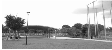
大泉学園町希望が丘公園

園町希望が丘公園」などがあります。みどりのネットワークの拠点づくりを進める長期プロジェクトとして、稲荷山公園は「武蔵野の面影」、大泉井頭公園は「水辺空間の創出」をテーマに、整備に向けた取組を進めています。