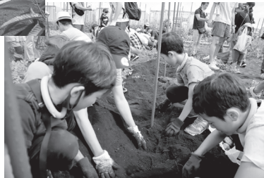
高松みらいのはたけ