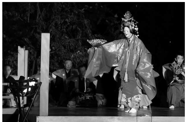
みどりの風 練馬薪能