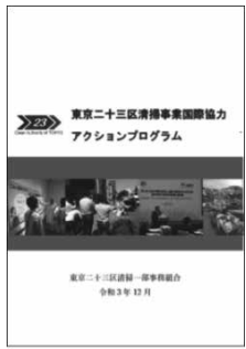
東京二十三区清掃事業国際協力アクションプログラム（表紙）

この基本理念と考え方に基づき、23区と清掃一組が協力し、東京23区における清掃事業の経験やごみ処理技術のノウハウ等を広く発信し、海外諸都市の課題解決に協力することで、地球環境の保全につなげていきます。