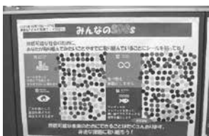
3Rの推進に向けたSDGsとごみについてのアンケートパネル

SDGsや23区と清掃一組による国際協力事業の取組、3Rの行動促進につながる参加型のパネル等の展示を行いました。説明スタッフがいらないパネル展示にもかかわらず多くの区民の方にご参加いただけました。