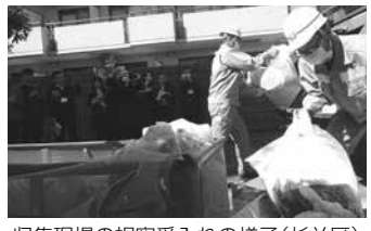
収集現場の視察受入れの様子（杉並区）

廃棄物問題の根本的な解決のためには、海外人材の育成が不可欠です。23区とともに、国や関係機関からの研修生の受入れの要請等に対し、収集現場や清掃工場の視察、座学による講義等も交え、効果的な学習の機会を提供していきます。