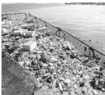
適正処理されずに海に流れ出しそうなごみを柵で止めている様子

今回は、新たに策定した事業計画「東京二十三区清掃事業国際協力アクションプログラム」（以下「AP」という。）に沿って国際協力事業をご紹介します。