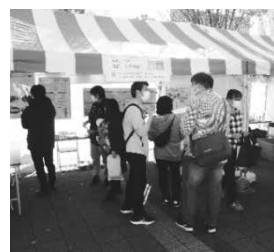
区の啓発イベントへの出展の様子（中野区）