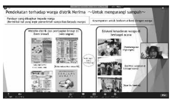
オンラインでの清掃事業の講義の様子（港区）

23区とともに、環境省等が進める海外諸都市への支援事業に継続的に参加し、現地行政担当者等に對して、ごみの分別・収集や清掃工場の建設・運営に関する知見を伝え、環境対策等を助言していきます。