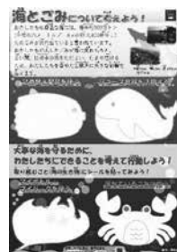
海洋ごみについてのパネル