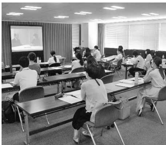
【「動機づけ面接」講義の様子】