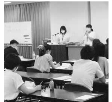
持寄事例発表の様子

今回の研修では、「クラスリーダー」として各区・一部事務組合より49名の方が登壇され、新任職員の先輩として体験談を交えながら進行をしていただきました。研修生は、クラスリーダーの体験談