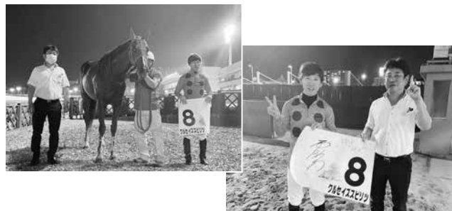
（特別区競馬組合開催サービス課）