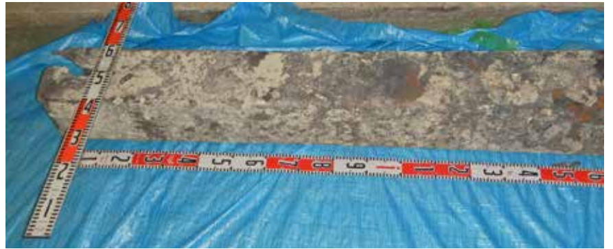
▲江戸川清掃工場に搬入された軽量鉄骨（180cm × 20cm × 20cm）（令和2年7月故障発生）