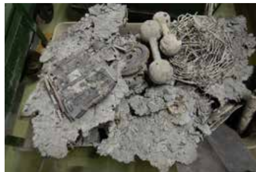
◀渋谷清掃工場の炉床から、はがし取った不燃物（アルミニウム等の金属が溶けて固まったものが、炉床を広く覆っていた）（令和2年8月故障発生）