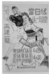
東京都選挙管理委員会ポスター