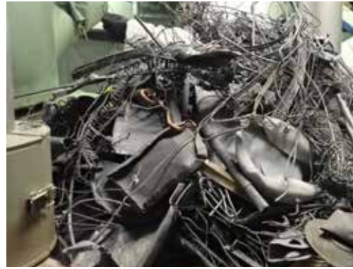
◀豊島清掃工場の焼却炉等から取り出した不燃物（令和2年4月故障発生）