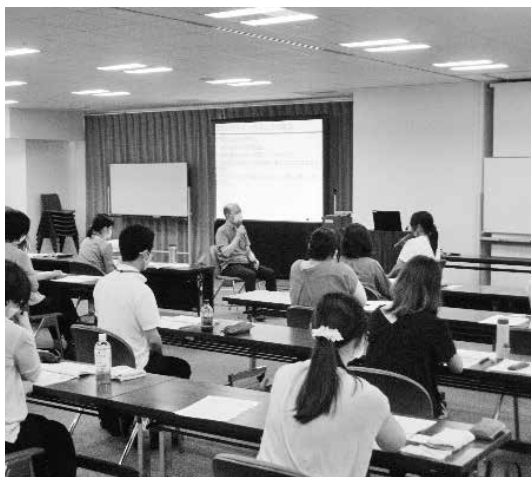
【「動機づけ面接」演習の様子】