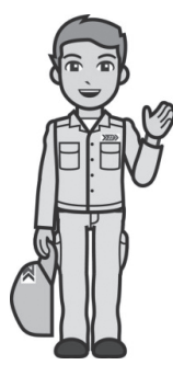
清掃工場のお兄さん