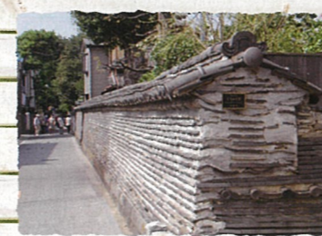
台東区：谷中「観音寺の築地塀」 谷中は坂と寺のまち。築地塀は、平成4年台東区まちかど賞を受賞。谷中のシンボルのひとつです。