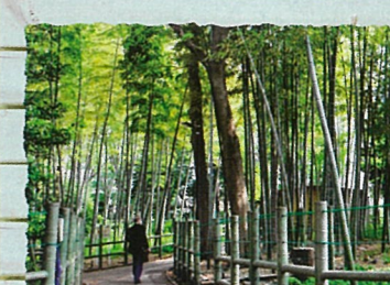
目黒区：すずめのお宿緑地公園 春の竹林は若い緑がいっきと鮮やか。園内にある古民家は昔の目黒を今に伝えています。