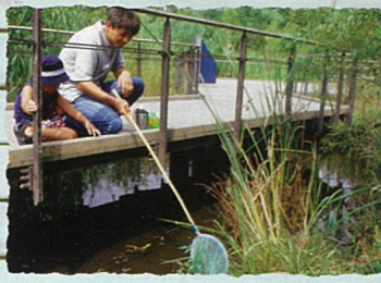
北区：赤羽自然観察公園 湧水も流れる緑豊かな園内は、季節の移ろいを体感できる都会のオアシスとして親しまれています。