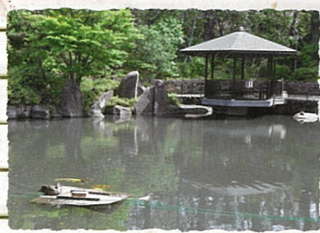
豊島区：目白庭園 新緑がまぶしい初夏、園の中央にある池ではカルガモ親子の仲睦まじい様子を見られるかも？