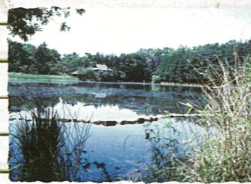
練馬区：石神井公園 桜の名所であるとともに、三宝寺池周辺ではミツガシワやカキツバタが花を咲かせます。