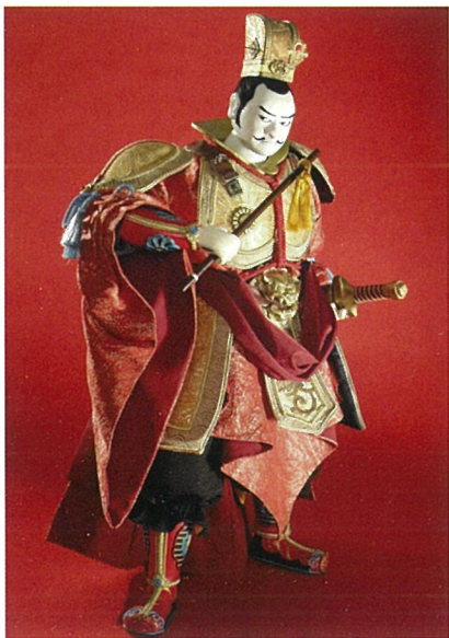
「三国志」より曹操孟徳