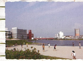
大田区：大森ふるさとの浜辺公園 入江や干潟を持つ海浜公園です。かつての大森海岸を再現。浜辺の浜風に癒されます。