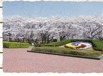
葛飾区：小菅西公園 水再生センターの屋上にあり、桜・ロウバイなど四季の花木が植えられ、花時計もあります。