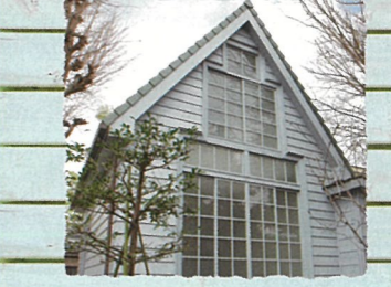
新宿区：佐伯祐三アトリエ記念館 北側の大きな採光窓などアトリエ建築を今に伝える展示室で、夭折の天才洋画家の作品に触れてみませんか。