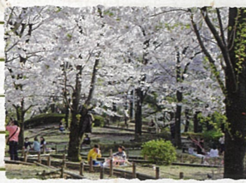
墨田区：隅田公園 墨堤の桜や日本庭園、釣り堀がある広い公園で、ゆったりとした下町の情緒が味わえます。