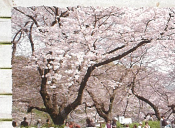
千代田区：千鳥ヶ淵緑道 桜の名所として有名な千鳥ヶ淵沿いの遊歩道は、四季折々の自然が満喫できる都心の憩いの場です。