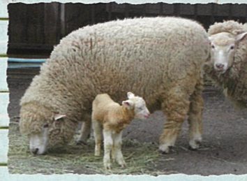
荒川区：荒川区立あらかわ遊園どうぶつ広場 都内唯一の区立遊園地です。どうぶつ広場ではヒツジやモルモットなどふれあえます。