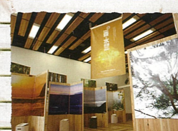
港区：港区立エコプラザ 間伐材をふんだんに使った環境学習施設です。館内には優しい木の香りが漂います。