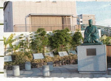
江東区：芭蕉記念館・史跡展望庭園 隅田川に面する芭蕉記念館の史跡展望庭園。松尾芭蕉とともに一句詠んでみては。