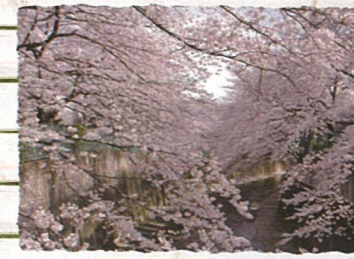
板橋区：石神井川の桜並木 桜川地区から加賀地区までの河川沿いには、約千本もの桜が咲き誇り、散歩におすすめ。