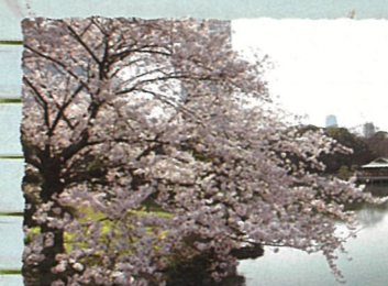
中央区：浜離宮恩賜庭園 四季折々の花が見られます。4月初～中旬には、桜のライトアップが行われます。