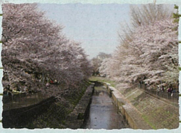
杉並区：善福寺川沿い 春の桜を始め、四季折々の表情を見せる善福寺川沿いは、地域の方々の憩いの場です。