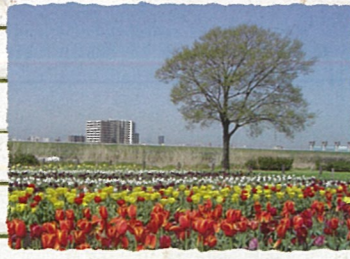
足立区：都市農業公園 農業を通して自然と触れあうことができ、五色桜やチューリップなどの花が楽しめます。