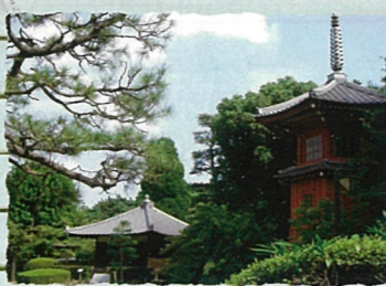
中野区：哲学堂公園 井上円了が精神修養の場として創設。園内には哲学に由来する建築物が点在しています。