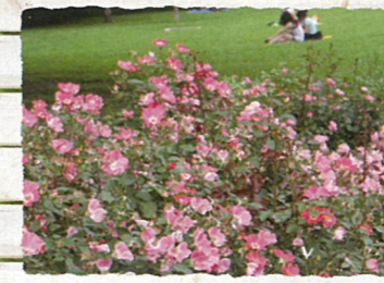
渋谷区：代々木公園 花の小径「バラの園」 甘い香りに誘われて蝶も遊びに来る、バラ33種類が5月下旬に見頃を迎えます。