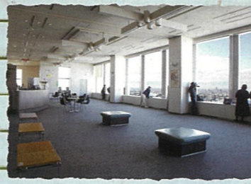
世田谷区：キャロットタワー26階展望ロビー (4/11まで休館、4/12リニューアルオープン予定) 富士山や区内を一望できるほか、レストランやエフエム世田谷のスタジオがあります。