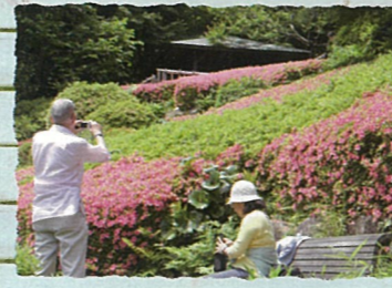
品川区：区立池田山公園 春のつつじを中心に四季の花々が咲く、岡山藩下屋敷跡の高低差を生かした回遊式庭園です。