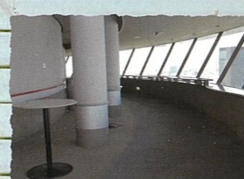
文京区：文京シビックセンター展望ラウンジ 展望ラウンジは330度の大パノラマ。富士山や東京スカイツリー®を望むことができます。