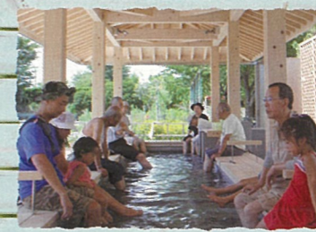
江戸川区：くつろぎの家足湯 清掃工場の余熱を利用した環境に優しい無料施設。ヒノキの香りが心と体をリフレッシュ。