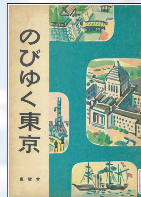
「のびゆく東京」表紙