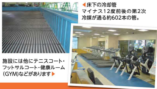
◀床下の冷却管 マイナス12度前後の第2次冷媒が通る約602本の管。

施設には他にテニスコート・フットサルコート・健康ルーム(GYM)などがあります▶