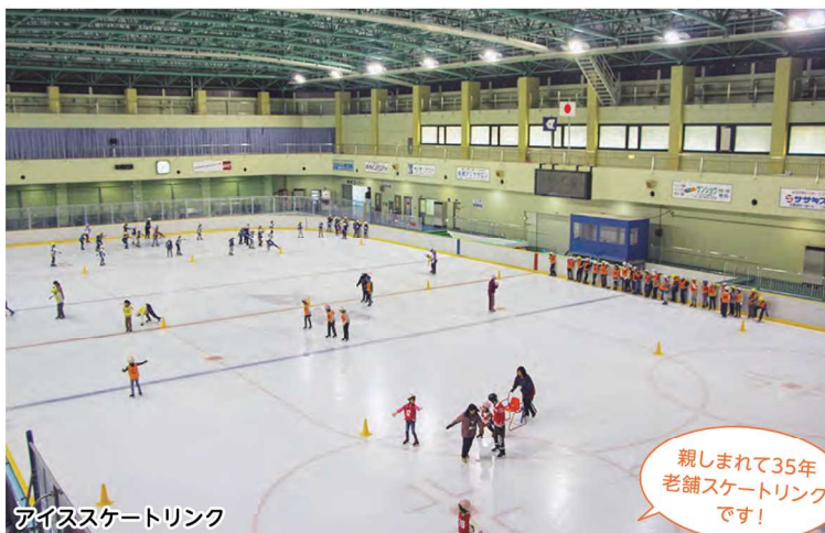
アイススケートリンク