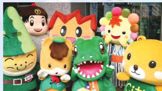
当日登場したキャラクターたち

また毎年恒例となった群馬県のキャラクター「ぐんまちゃん」をはじめとした県内市町村のキャラクターに加え、今年度は公益財団法人特別区協議会のキャラクター「とくべつくま®」も登場し、会場を盛り上げてくれました。