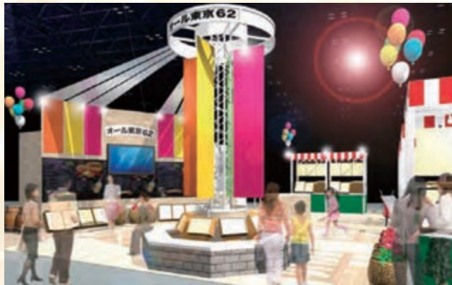
出展ブースイメージ

5年目となる今年度は、「東京ecoの市(エコのいち)~みんなでささえる地球のあした~」をテーマに、各自治体の個性豊かな環境活動を親しみやすく紹介します。東京全62市区町村の参加によるテーマ映像や38自治体(※)によるパネル展示・ワークショップ・ステージショーなど盛りだくさんの内容で、皆さまのご来場をお待ちしています。詳しくはコチラ http://all62.jp/