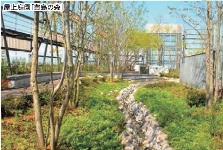
屋上庭園「豊島の森」

平成31年度には、旧庁舎跡地で計画している新ホールを含む文化にぎわい施設のオープンを予定しており、としまエコムーゼタウン、あうるすぽっと、サンシャインシティと、回遊の楽しみが更にひろがるはず。今後ますますパワフルに変貌していく豊島区から、目が離せません!