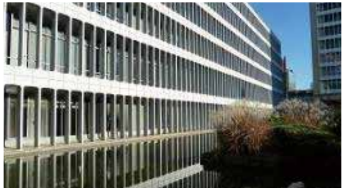
↑アルミ鋳物のたて格子の外観

訪れた人たちに親しまれる開かれた庁舎として、建物を利用したウェディング事業やロケーション誘致事業なども行っています。まもなく竣工後57年を迎える総合庁舎は、建物や設備の経年劣化を課題と捉えています。故村野藤吾氏が情熱を傾けた文化的価値の高い建築物である事を踏まえ、美観を損なうことなく、建物として維持保全や設備面での機能の向上に力を入れ、後世に引き継ぐ施設を目指しています。