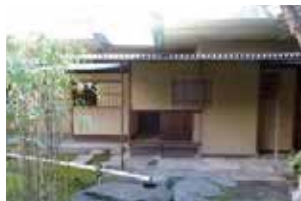
↑ビルの中とは思えない茶庭と茶室