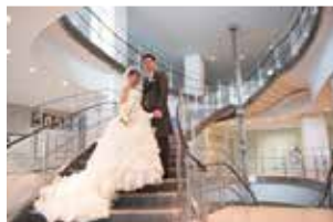
↑庁舎でのウェディング