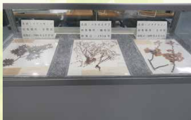
特別区自治情報・交流センターでの標本展示