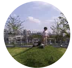
↑屋上庭園の芝生・キッズパークエリア