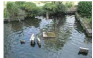
↑「心」の字の石組みのある中庭の池