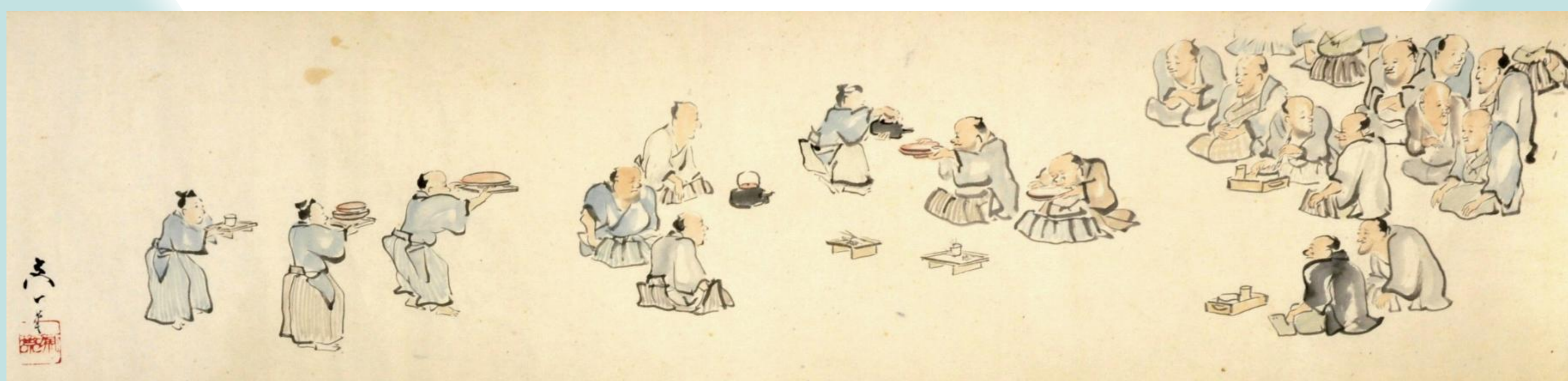
▲ <<後水鳥記>>江戸時代（郷土博物館蔵）

文化12(1815)年、飛脚宿の主人中屋六右衛門の還暦を祝い、江戸と近郊から酒量自慢の酒豪を招いて大酒戦会（飲み比べ）が行われました。「千住の酒合戦」と呼ばれたこの酒宴には、酒井抱一や谷文晁、亀田鵬斎といった名だたる文人・絵師が審査員として招かれ、その様子は後に彼ら文人と大田南畝によって『後水鳥記』としてまとめられました。