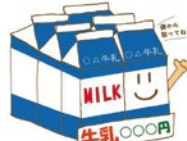
てまえ取りの推奨