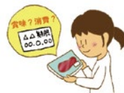
賞味期限消費期限を正しく知ろう