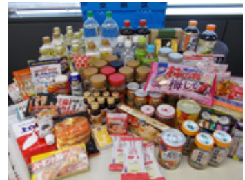
▲フードドライブでお預かりした未利用食品