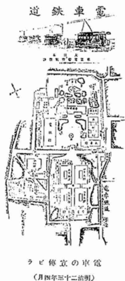
電車の宣伝ビラ『東京電灯株式会社開業五十年史』

明治23年(1890)、東京上野公園で開催された第3回内国勸業博覧会に、アメリカ人技師スプレーグによる最新鋭の電気鉄道車が参考展示され、そのデモ走行には期間中約30万人が乗車したといわれています。