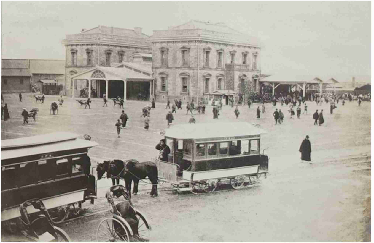
明治20年代頃の新橋駅『東京府写真帖』