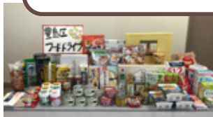
過去に集まった食品