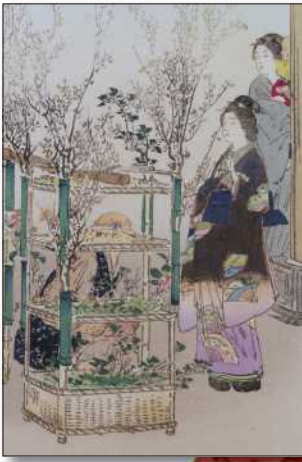
『月耕随筆 花売る人花活る人』(部分) 尾形月耕画