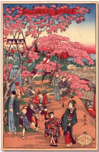
『東京名所鑑 王子飛鳥山之図』 武英画