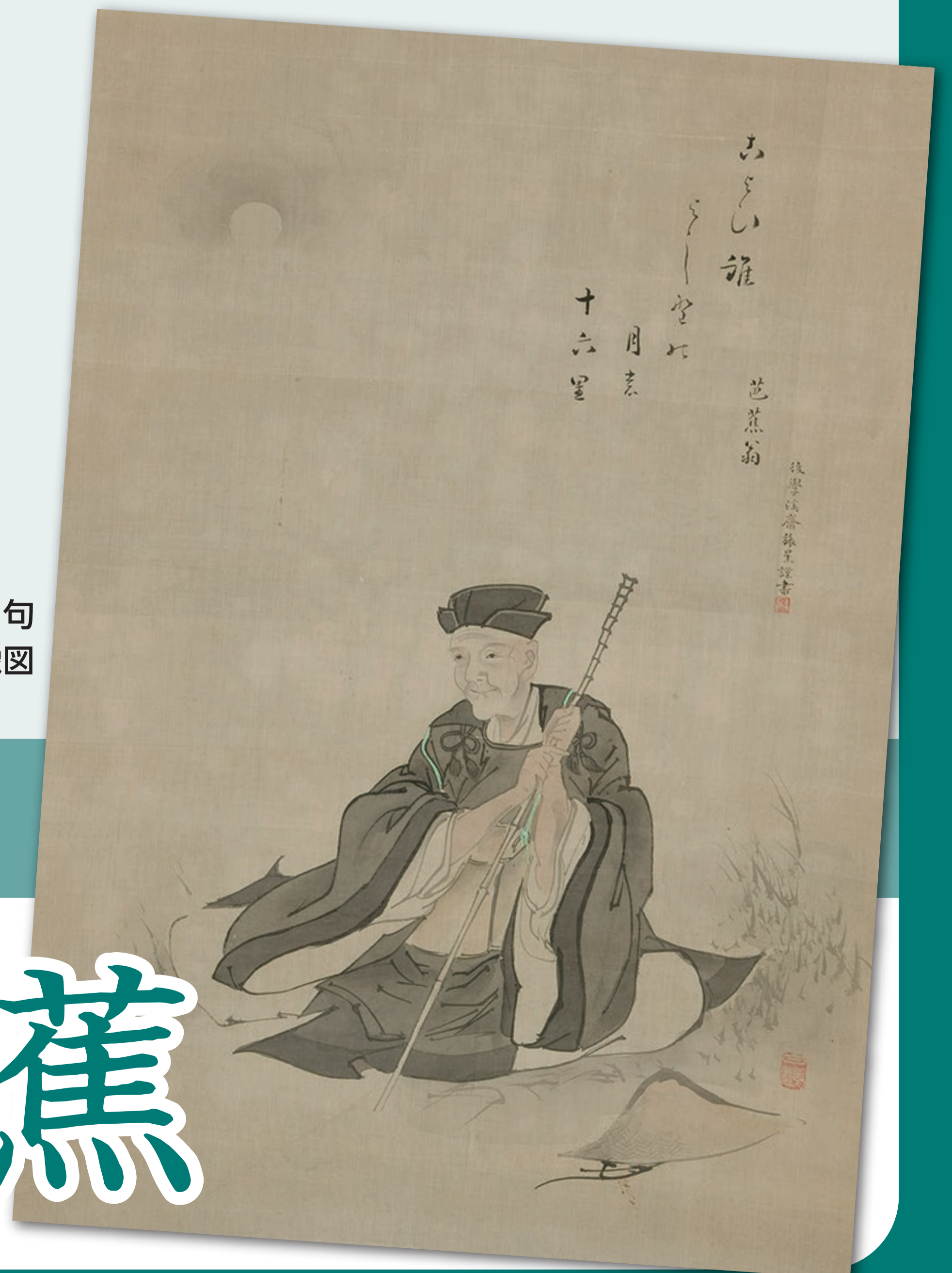
白鷗画・溪斎賛「こよひ誰」句 芭蕉坐像図