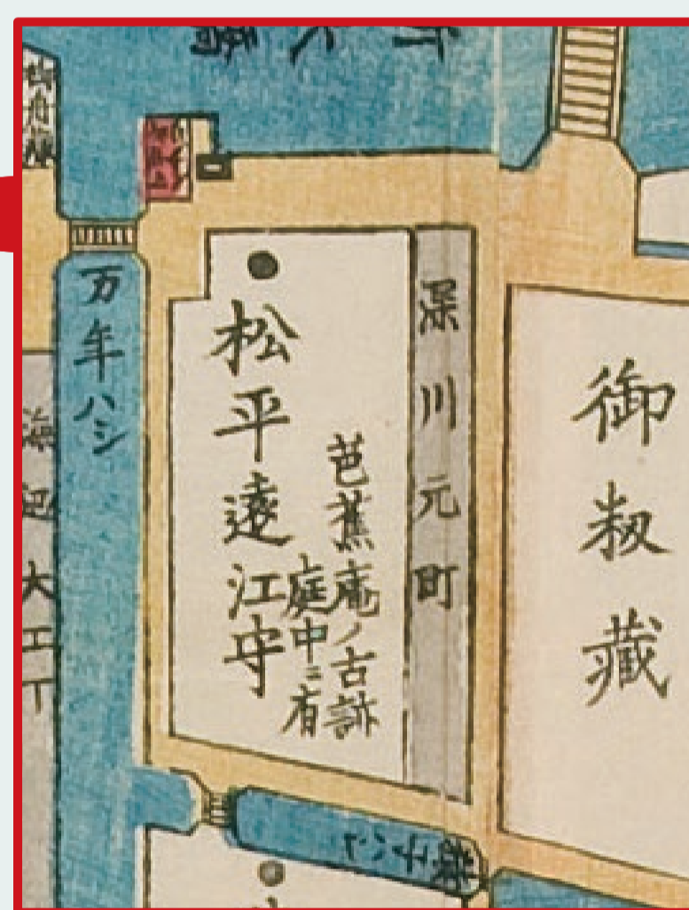
松平遠江守の屋敷内に 「芭蕉庵ノ古跡庭中ニ有」 と記されています。