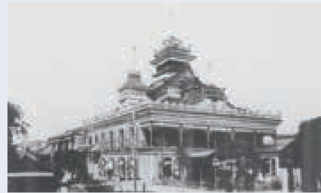
第一国立銀行(『第一銀行五十年小史』)