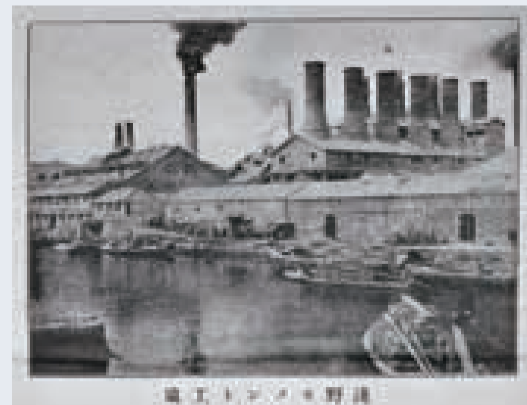
『新撰東京名所図会』(個人蔵)