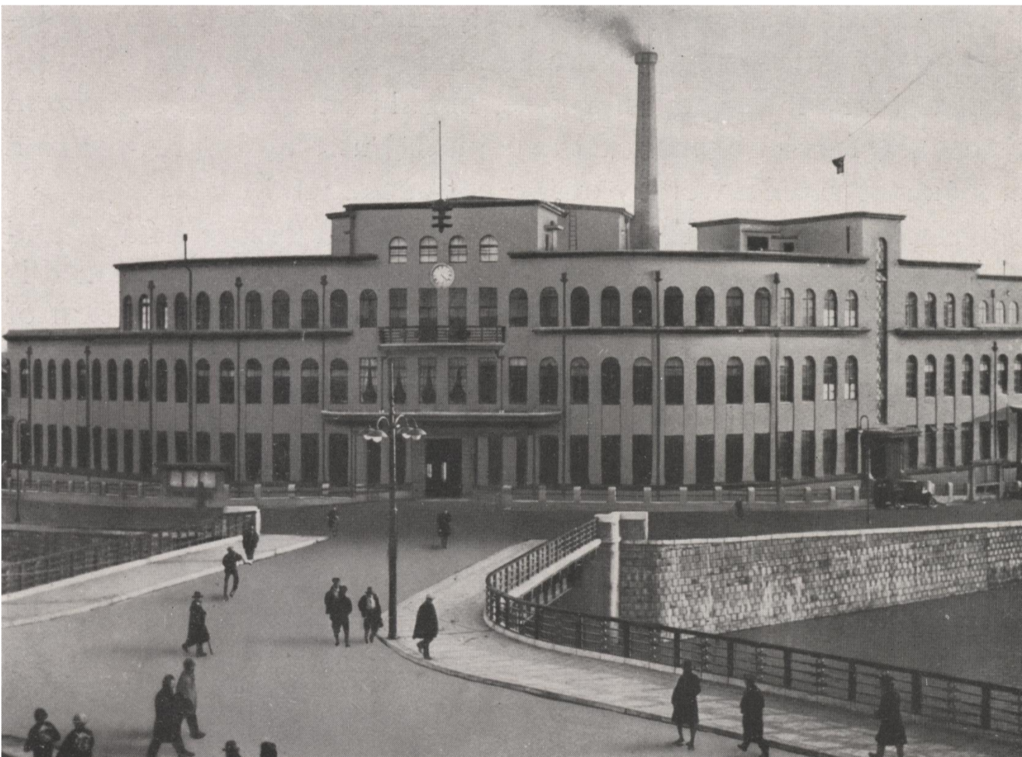
上:「京橋区役所庁舎新築工事設計図 立面図」『市役所庁舎・区役所庁舎 区役所庁舎』(請求番号:313. A3. 09)【重文】、下:Kyobashi Ward Office, built after the catastrophe, "TOKYO CAPITAL of JAPAN1930" (請求番号:市刊 K258)

復興区役所庁舎の外観は、メインとなる玄関を軸として左右対称（シンメトリー）に、近代化を象徴するモダンなデザインが施されました。また、屋外には電気時計とともに避雷針も設置されました。