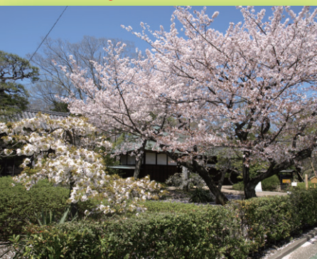
長屋門前のサクラ