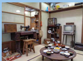
常設展示「昭和のくらし」