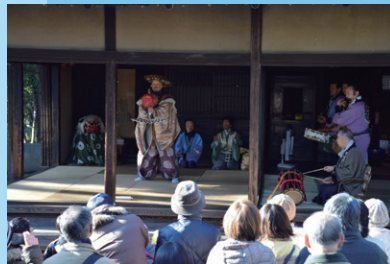
大宮前の獅子舞・大黒舞