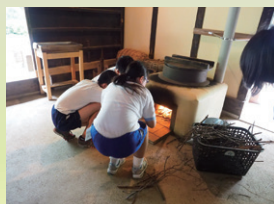
中学生の職場体験でカマドの火入れを体験してもらいました。