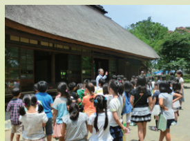
毎年区内のたくさんの小学生が見学に来ます。