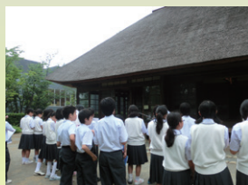
区内の中学生も見学に来ています。