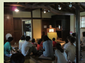
かみしばいの読み聞かせ。