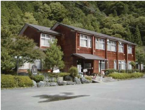
懐かしい校舎に泊まれるヘルシー美里（光源の里温泉）

町内には、小学校や中学校の校舎を利用した温泉宿泊施設や、全室源泉かけ流しの湯のお風呂がついたコテージなど、魅力的な宿泊施設もたくさんあります。