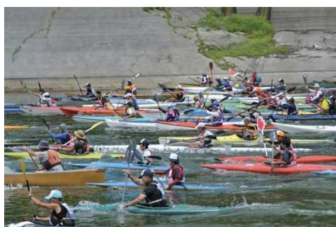
カヌーマラソン大会 (海の日の前日に開催)