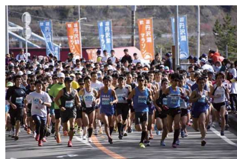
丹沢湖ハーフマラソン大会 (11月最終日曜日)