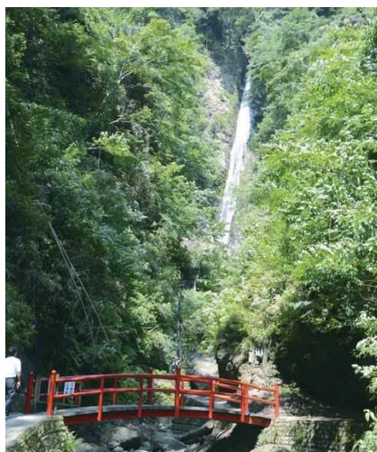
日本の滝百選、全国名水百選に選ばれた酒水の滝

また、科学的根拠に裏付けられた森林浴効果が味わえる森林セラピーロードや、山々の中で楽しめる温泉施設も多くあり、心身ともにリフレッシュした気分を味わえます。