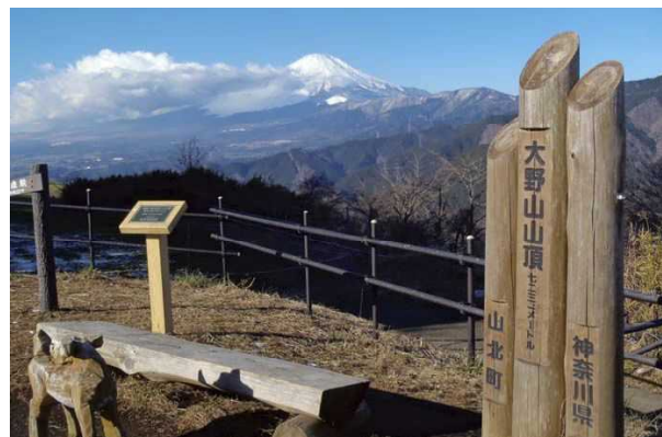
関東の富士見百景に選ばれた大野山