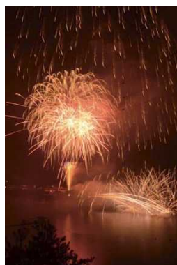
丹沢湖花火大会 (8月10日)