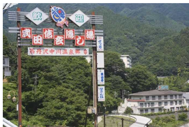
武田信玄の隠し湯と伝えられる中川温泉