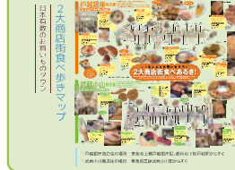
品川区の個性豊かな商店街 品川区には、100を超える商店街があり、戸数豊富で古きよき商店街という大きな商店街もあります。お買い物はもちろん、お食事もしやすいお店が並んでいます。毎年11月には、「しながわいウォーク」という戸数豊富な商店街や中商店街など品川区内の15の商店街を巡るイベントも開催されます。

品川区には、100を超える商店街があり、戸数豊富で古きよき商店街という大きな商店街もあります。お買い物はもちろん、お食事もしやすいお店が並んでいます。毎年11月には、「しながわいウォーク」という戸数豊富な商店街や中商店街など品川区内の15の商店街を巡るイベントも開催されます。