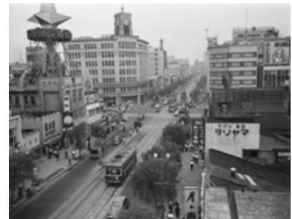
都電が走る銀座通り 昭和30(1955)年6月20日撮影