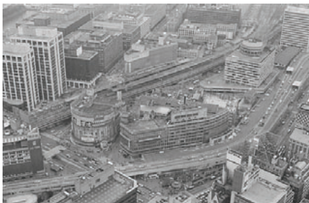
有楽町駅周辺（千代田区） 昭和56年2月27日撮影

今回の写真展は、3月の写真展で使用した23区の写真から34点選定し、新たに選定した写真を加えて、計48点で構成しています。都政記録写真に収められた東京23区の姿をご覧ください。