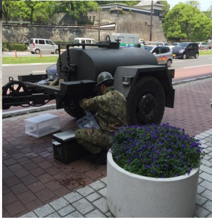
熊本市役所前 歩道