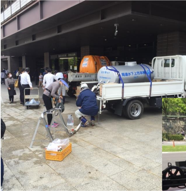
熊本市役所前 ピロティ