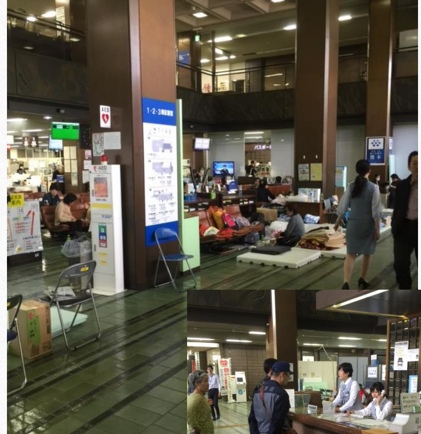
熊本市役所 ロビーと受付