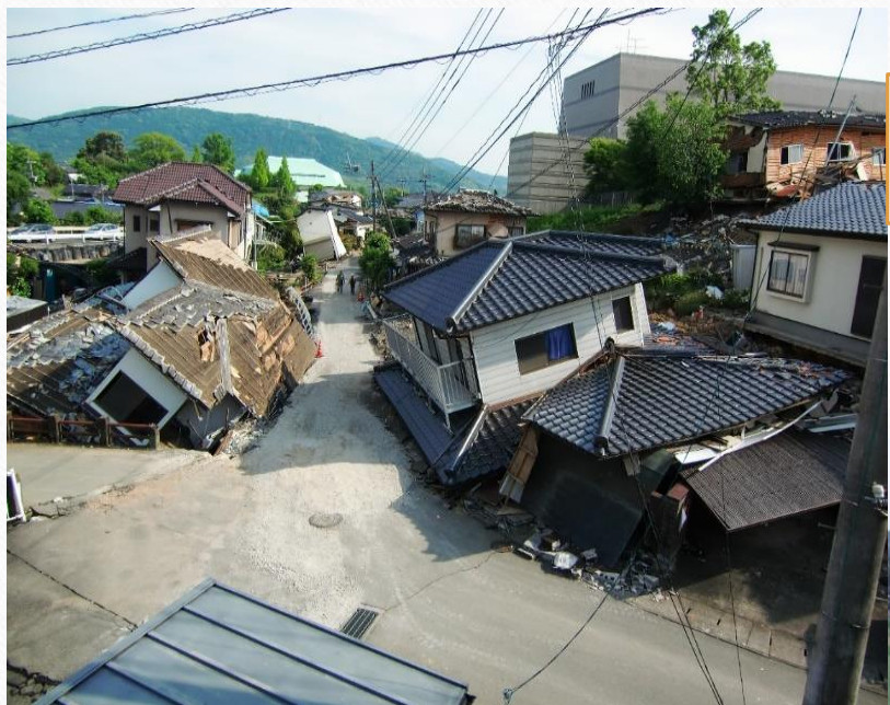
地震直後の 民家倒壊状況