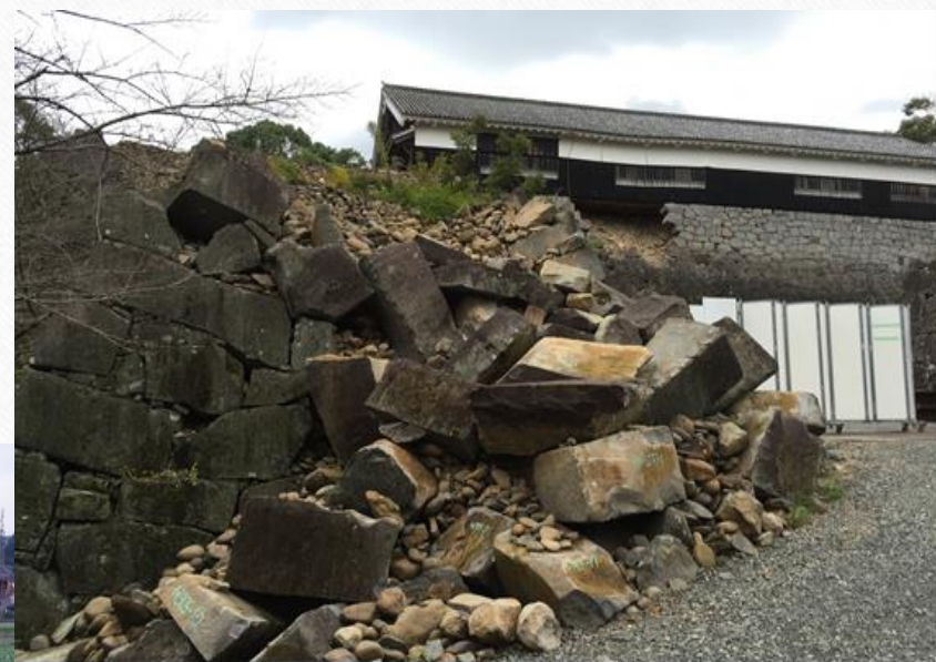
崩れた熊本城の石垣。 破片ひとつひとつにも 番号が付番されている。