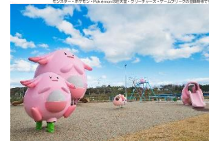
ラッキー公園 in なみえまち