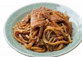
B1-ゴールドグランプリ なみえ焼そば