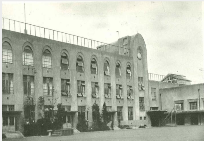
九段小学校 (旧上六小) 千代田区三番町 大正15年(1926)竣工