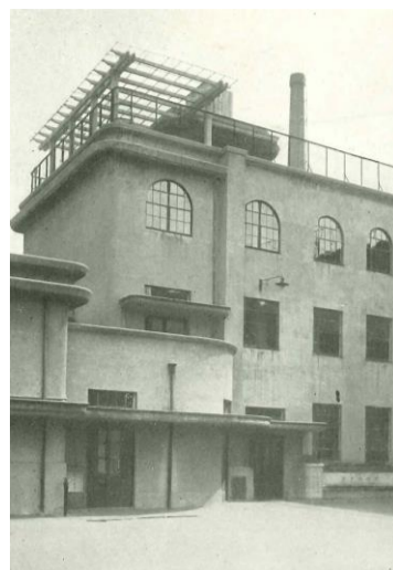
じゅっし 旧十思小学校 (十思スクエア) 中央区日本橋小伝馬町 昭和3年(1928)竣工