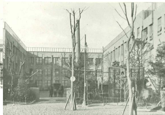
旧元町小学校 (整備中) 文京区本郷 昭和2年(1927)竣工