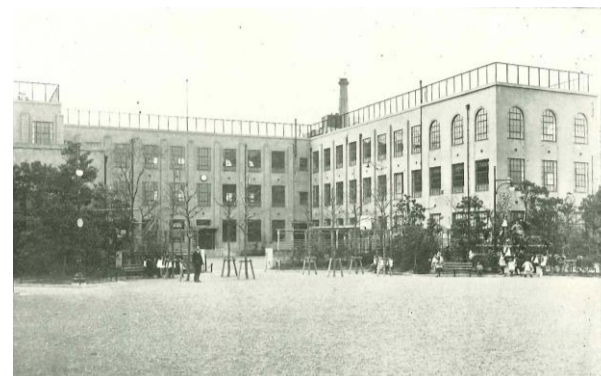
旧箱崎小学校 (水天宮ピット) 中央区日本橋箱崎町 昭和3年(1928)竣工