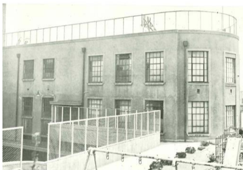
旧京華小学校 (京華スクエア) 中央区八丁堀 昭和4年(1929)竣工