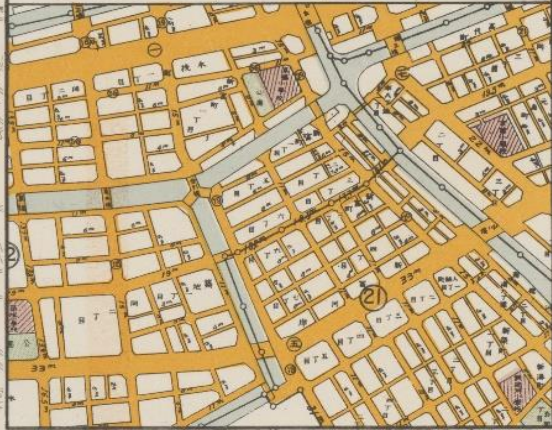
土地區劃整理後之京橋附近